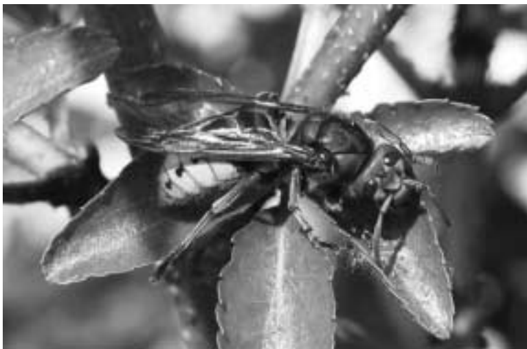
Hornissen-Königin (Peter Schlup)

Wespen- und Hornissenstiche sind übrigens nicht schlimmer als Bienenstiche!