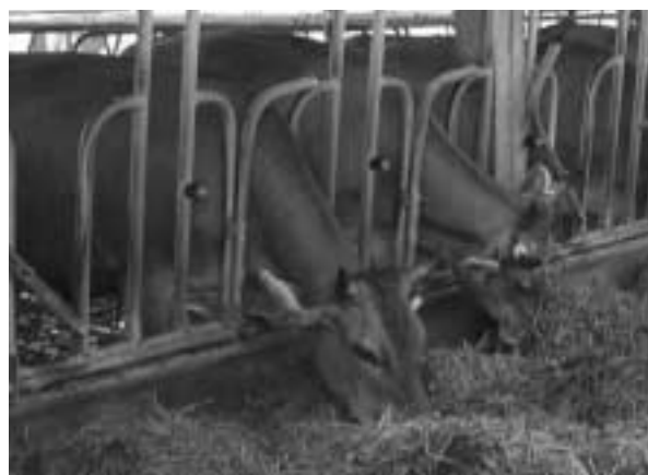
Im richtig dimensionierten Schweden- oder Rundbogengitter können Kühe mit Hörnern leicht den Kopf aus dem Gitter nehmen.