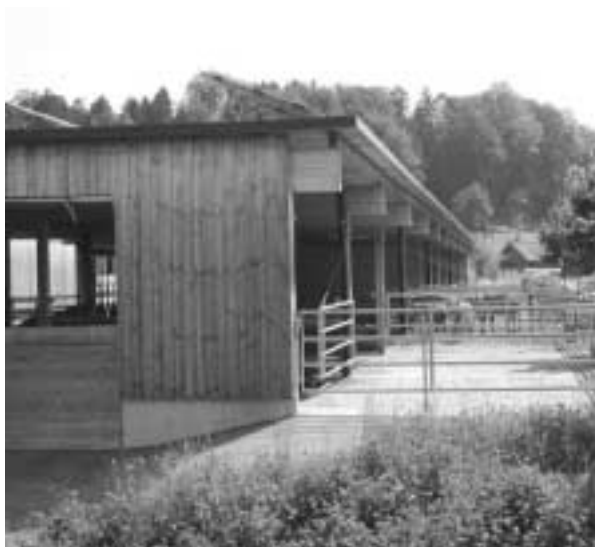
Der grosszügige Laufhof dient als Wartebe- reich vor dem Melken.