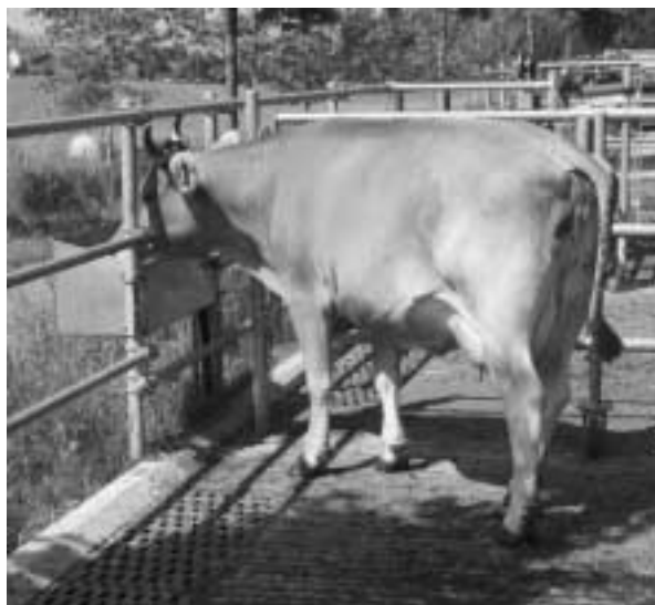
Die Tränke im Laufhof ist für alle Tiere leicht zugänglich.