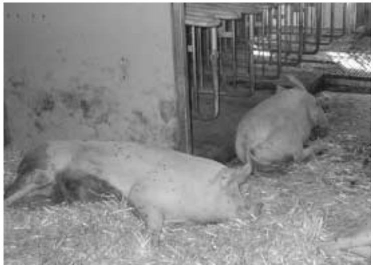
Vier-Flächen-Bucht mit Fressliegeboxen, Laufgang, eingestreutem Liegebereich und Auslauf .

Während Sauen, die sich nicht kennen, beim Gruppieren heftige Rankämpfe ausführen, kämpfen abgesetzte Sauen, welche sich vom Wartestall her kennen, in der Regel kaum miteinander. Es ist deswegen wichtig, dass man möglichst immer dieselben Sauen nach dem Absetzen zusammenbringt. Auch Sauen aus einer Grossgruppe kennen einander, und es gibt weniger Auseinandersetzungen. Da es sich allerdings manchmal nicht vermeiden lässt, Sauen aus verschiedenen Gruppen, zum Beispiel «Umrauscher», neu in eine Gruppe zu bringen, ist es von Vorteil, ein oder zwei separate Buchten zu haben, in welchen man die neuen Tiere solange halten kann, bis sich das Gesäuge der frisch abgesetzten Sauen zurückgebildet hat. Dieses ist bei Kämpfen nämlich besonders gefährdet.