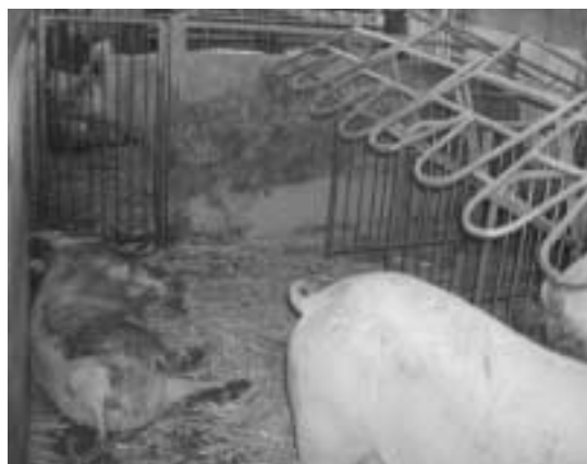
Drei-Flächen-Bucht mit Fressliegeboxen, Laufgang, und Auslauf. Ein separater Liegebereich fehlt.

Ein erster Schritt, auf Einzelstände zu verzichten, war der Einbau von Fressliegeboxen mit einem Laufgang dahinter und meistens mit einem Auslauf, die sogenannten Drei-Flächen-Buchten. Wenn die Tiere in diesen Buchten in Ruhe liegen möchten, müssen sie dazu die Fressliegeboxen nutzen. Die Tiere können nicht zusammen liegen und sich vor allem im Winter nicht gegenseitig wärmen. Dies ist nur bei einem separaten Gemeinschafts-Liegeplatz in der Vier-Flächen-Bucht möglich. Die vierte Fläche bringt auch dem Tierhalter Vorteile, da dann in den Fressliegeboxen kaum Mist anfällt.