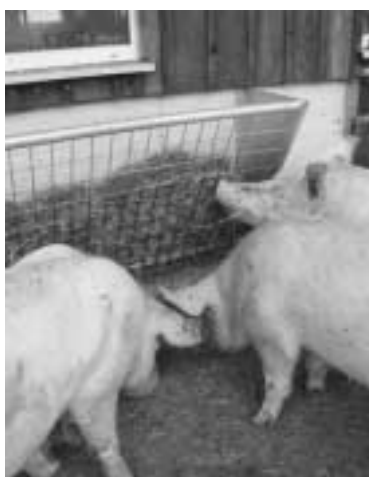
Heuraufe im Auslauf zur Beschäftigung.

Nach dem Absetzen füttert man Sauen zurückhaltend. Die restriktive Fütterung hat zum Ziel, die Milchproduktion im Gesäuge zu verringern und den sogenannten Flushing Effekt zur Stimulation der Rausche zu verstärken. Der Flushing Effekt entsteht dadurch, dass man Sauen nach einem kurzen Fasten wieder mehr Futter verabreicht, so dass es zu einem „Energiestoss“ kommt. Die Sauen haben also vor allem in den ersten Tagen nach dem Absetzen Hunger. Es ist deswegen wichtig, dass sie gerade in dieser Zeit rohfaserreiches Material wie Heu, Stroh, Chinaschilf oder Silage aufnehmen und sich damit beschäftigen können. Man sollte dieses wenigstens zwei Mal am Tag in einer Raufe oder direkt im Trog anbieten. Es ist falsch, den Sauen am ersten Tag nach dem Absetzen gar kein Futter zu geben, da sie auf eine solche abrupte Umstellung physiologisch nicht vorbereitet sind. Richtig ist es, die Sauen und die Ferkel schon in der Abferkelbucht auf das Absetzen vorzubereiten und beim Absetzen auf ein rohfaserreicherer Sauen-Futter umzustellen. Während der Umstellungsphase von der Einzel- in die Gruppenhaltung, während der Rausche und insbesondere beim Einführen neuer Tiere muss der Tierhalter seine Tiere gut beobachten und eventuell steuernd eingreifen, zum Beispiel, indem er ein Tier aus der Gruppe herausnimmt oder kurzzeitig in einer Fressliegebox einsperrt. Auf diese Weise lässt sich der soziale Stress vermindern.