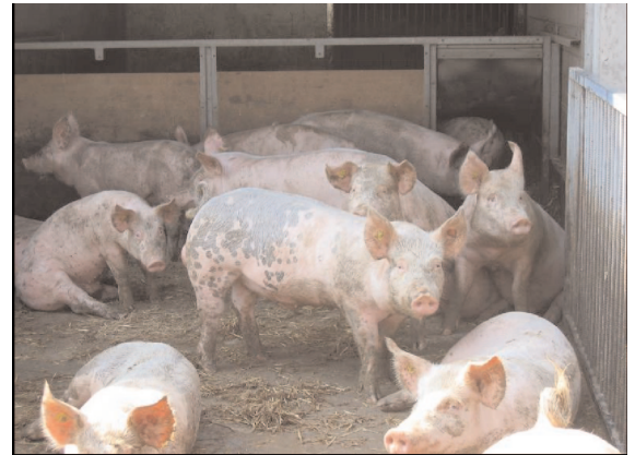
Jungebermast auf dem Juchhof

Allerdings ist die Methode nicht ganz unproblematisch. Um sicher zu gehen, dass kein Fleisch mit Ebergeruch zum Verzehr gelangt, müssen alle Schlachtkörper getestet werden. Nach Versuchen der Arbeitsgruppe «ProSchwein» trat der Ebergeruch bei etwa 6 % der Jungeber und je nach Zusammensetzung des Futters teilweise sogar bei mehr Tieren auf. Die Entwicklung einer sogenannten «elektronischen Nase» zum Erkennen des Ebergeruches ist noch nicht soweit fortgeschritten, dass sie sich für eine 100 prozentige Erkennung in der Praxis einsetzen liesse. Es braucht deswegen immer noch den «Kochtest», der zusätzliche Arbeitskräfte im Schlachthof benötigt.