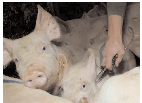
Kastration durch Impfung

Die zweite praktikable Methode ist eine Impfung gegen Ebergeruch. Diese erlaubt, auf den chirurgischen Eingriff ganz zu verzichten. Das schweizerische Institut für Viruskrankheiten und Immunprophylaxe IVI hat im Januar 2007 einen Impfstoff der Firma Pfizer AG für den Einsatz in der Schweizer Schweinehaltung zugelassen. Die Tiere müssen damit zweimal geimpft werden. Der Impfstoff wurde zugelassen, da er gentechnikfrei ist und keine hormonelle Wirkung hat. Er wirkt wie ein konventioneller Impfstoff, indem er die Bildung von Antikörpern stimuliert, welche vorübergehend die Hodenfunktion und damit den Ebergeruch unterdrücken. Es sind keine Rückstände im Fleisch der geimpften Tiere nachweisbar.