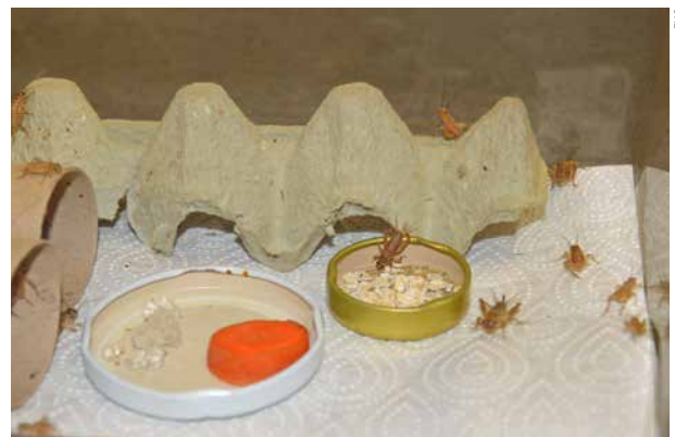
Auch Futtertiere brauchen genügend Platz und Nahrung.