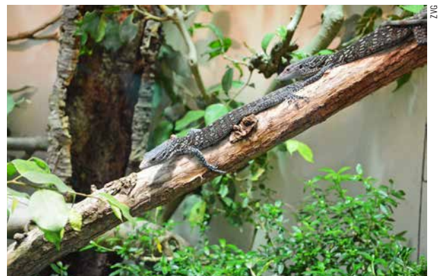
Beispiel eines Feuchterrariums.