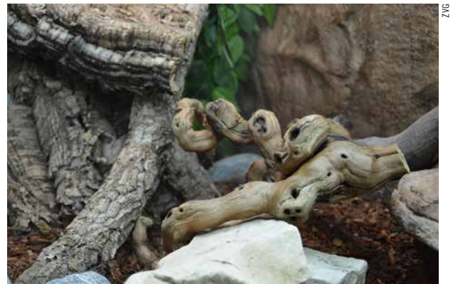
Natürliche Einrichtungsgegenstände wie Steine, Äste, Korkröhren etc. dienen den Reptilien als Kletter- und Rückzugsmöglichkeiten.

Schutzhaus: Bei der Haltung von Landschildkröten im Freilandgehege ist auch während den Sommermonaten ein Schutzhaus notwendig, worin sich die Tiere bei kühler oder nasser Witterung zurückziehen können. Schutzhäuser kann man selber bauen oder im Fachhandel erwerben. Sie sollten sich bei Bedarf beheizen lassen, gleichzeitig dürfen sie sich bei Sonneneinstrahlung aber auch nicht zu stark aufheizen. Weiter müssen sie «einbruchsicher» gestaltet sein und die Schildkröten vor Wildtieren wie Marder, Fuchs und Dachs schützen.