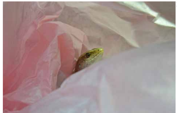
Dieses Blumeneinwickelpapier erregte grosse Aufmerksamkeit.

Der altbekannte Satz «Abwechslung macht das Leben süß» gilt auch für Reptilien! Nebst einer artgerechten und vielfältigen Einrichtung (welche gelegentlich verändert wird) freuen sich die Tiere auch über abwechslungsreiches Futter. Futter kann zudem so angeboten werden, dass die Tiere dafür arbeiten müssen. 10 Auch Düfte sind für Reptilien sehr interessant, beispielsweise kann das Terrarium mal mit ungiftigen duftenden Wiesenblumen bestückt oder mit Tee besprüht werden. Manche Echsenarten können zudem mittels Targettraining einfache Befehle erlernen.