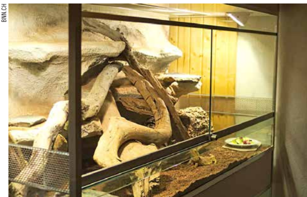
Beispiel eines Trockenterrariums.

Feuchterrarium: Feuchterrarien beherbergen unter anderem Bewohner von tropischen Regenwaldgebieten wie beispielsweise Wasseragamen. In Feuchterrarien liegt die Luftfeuchtigkeit in der Regel über 70%. Infolge der hohen Luftfeuchtigkeit bestehen die Terrarien vorzugsweise aus Glas oder Kunststoff. Wird Holz verwendet, so muss es speziell behandelt werden. Damit in der Wohnung