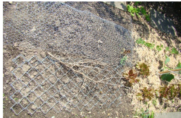
Flach ausgelegtes Kompostgitter oder Maschendraht sowie Rosen- und Brombeerranken halten Katzen davon ab, ein Beet als Katzenklo zu benutzen.