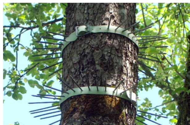
Katzenabwehrgürtel zum Schutz von Vogelnistkästen auf Bäumen haben sich bewährt.