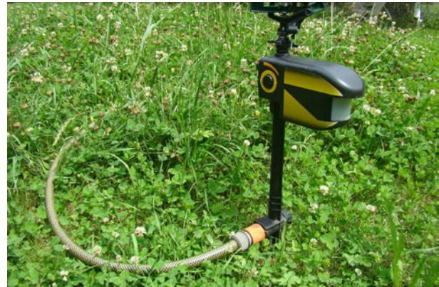
Die Scarecrow (Vogelscheuche), eine automatisierte Wasserpistole zur Katzenabwehr im Garten.

Beete lassen sich vor Katzenkot schützen, indem man abgeschnittene Brombeerranken oder ein Kompostgitter flach auf das Beet legt. Die Pflanzen wachsen problemlos durch, das Gitter verhindert aber, dass Katzen scharren können, darum koten sie dort nicht gerne. Katzenforscher empfehlen ausserdem, Kaffeesatz in betroffene Beete zu streuen, und zwar für einige Wochen. Katzen bekommen beim Koten und Scharren den Kaffee an die Pfoten. Wenn sie sich dann sauberlecken, schmecken sie den Bitterstoff im Kaffee. Es braucht einige Zeit, bis sie die Verknüpfung zwischen dem Kotplatz und dem unerwünschten