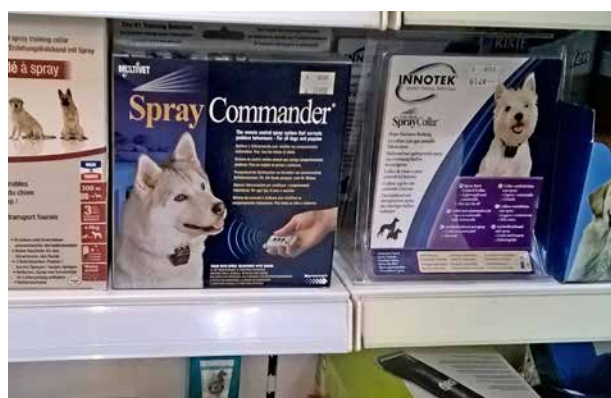
Geräte wie Spray Commander und Spray Collar sind in der Anwendung verboten.