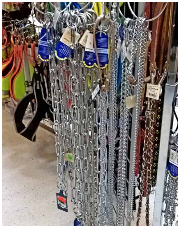
Würgeleinen und Würgehalsbänder ohne Stopp finden sich noch – aber zum Glück immer weniger – im Verkauf, obwohl deren Anwendung verboten ist.

Wurfkette: Mit der Wurfkette wird der Hund für ein Fehlverhalten bestraft. Das Geräusch der Kette, wenn sie auf den Boden fällt, wird vom Hund als sehr unangenehm empfunden. Damit der Einsatz einer Wurfkette beim Hund keinen Schaden verursacht oder ihn in Angst versetzt, sollte die Wurfkette nur im richtigen Moment und mit Fachwissen eingesetzt werden. Der unsachgemässe Einsatz der Wurfkette ist verboten – der Verkauf der Wurfkette ist hingegen erlaubt! Beim Verkauf dieses Produktes muss der Kunde daher entsprechend fachlich beraten werden.