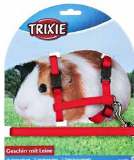
Kleintier-Geschirr für Meerschweinchen.