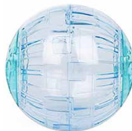
Hamsterball: Kann Hamster in Angst und Schrecken versetzen.