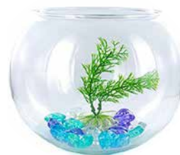
Die Haltung von Fischen im Kugelglas ist Tierquälerei.

Kugel- und Miniaturaquarien: Fischen, die in Goldfischkugeln gehalten werden, fehlt die Möglichkeit, sich zu orientieren oder sich zurückzuziehen. Für die Tiere stellt dies eine grosse Belastung dar. Darüber hinaus können sich durch den fehlenden Filter und die geringe Grösse der Kugeln keine stabilen Wasserwerte einstellen, was zu erheblichen Beeinträchtigungen des Gesundheitszustandes oder unter Umständen bis zum Tod führt. Durch die kleine Wasseroberfläche ist nur ein unzureichender Austausch mit Luftsauerstoff möglich. Auch Miniaturaquarien, Säulenaquarien und so genannte «lebende Gemälde» bieten den Fischen aufgrund geringer Breite des Aquariums keine ausreichende Bewegungsmöglichkeit. Ausserdem können keine stabilen Wasserwerte erreicht werden.