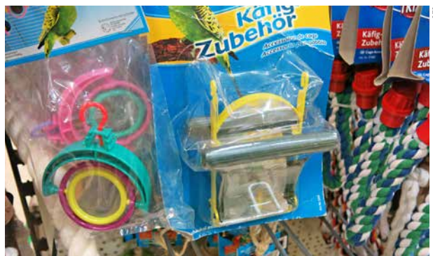
Spiegel sind kein Ersatz für ein Partnertier.

Spiegel: In den Vogelkäfig gehängte Spiegel dienten früher dazu, alleine gehaltenen Vögeln einen Partner vorzugaukeln. In der Zwischenzeit ist die Einzelhaltung von Vögeln verboten. Spiegel sind aber nach wie vor erhältlich. Spiegel sind kein Ersatz für ein Partnertier, auch können sie zu Verhaltensstörungen wie z. B. ständiges Füttern des vermeintlichen Partners mit Folge von Kropfentzündung führen.