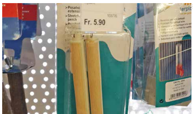
Plastiksitzstangen können zu Sohlengeschwüren führen.

Sitzstangen aus Plastik: Plastiksitzstangen, vor allem solche mit Rillen, können zu Sohlengeschwüren führen. Die Tierschutzverordnung schreibt zudem Sitzgelegenheiten unterschiedlicher Dicke vor sowie Sitzgelegenheiten, welche federn. Enthält ein Vogelkäfig nur Plastiksitzstangen, so ist die Haltung nicht gesetzeskonform. Aus Sicht des STS sollten keine Plastiksitzstangen, sondern nur aus natürlichem Material bestehende Sitzgelegenheiten verwendet werden.