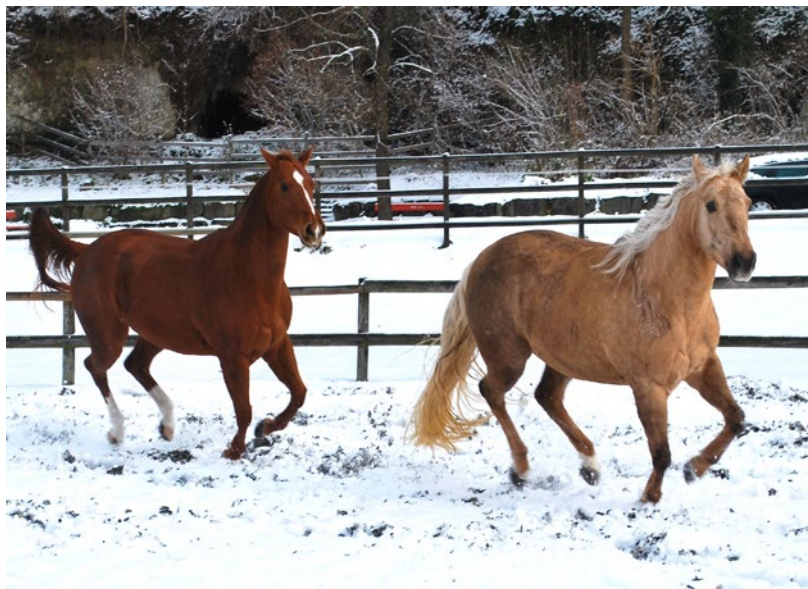
LABEL STALL BIG STONE RANCH, KIRCHLEERAU

Allerdings ist mittlerweile ein Trend zur Gruppenhaltung feststellbar. Auch hier werden die meisten Pferde jedoch nachts alleine in ihren Boxen gehalten. Dies entspricht in den meisten Fällen den Wünschen der Pferdebesitzer. Es herrschen viele Vorurteile gegenüber der permanenten Gruppenauslaufhaltung. Viele Halterinnen und Halter sind überzeugt, dass ihr Pferd nachts Ruhe braucht. Rangniedrigere Pferde sollen sich erholen können und zu genügend Futter gelangen. Es kann einfacher sein, die Fütterungsrationen spezifisch an jedes einzelne Pferd in der Box abzugeben. Denn es gibt sowohl leicht- als auch schwerfuttrige Pferde.