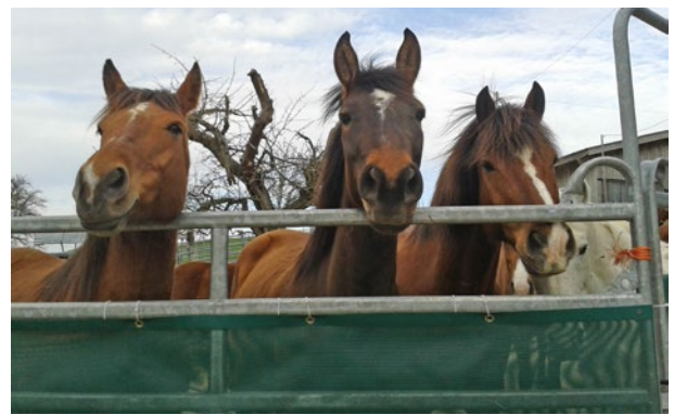
STALL WHITE HORSE RANCH, BAGGWIL

Ist ein sehr altes Pferd gar nicht mehr wohl in der Gruppe, gibt es beim STS-Pferdelabel für solche Fälle auch Ausnahmeregelungen.