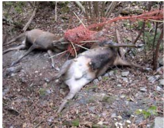
Strangulierte Hirsche in Weidenetz

Knotengitterzäune und Steckzäune sind als permanente Weidezaunsysteme grundsätzlich problematisch. Extrem tierschutzrelevant werden sie bei unsachgemäßem Handling und fehlender oder langer Überwachung.