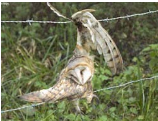
Schleiereule in Stacheldraht

Freiwilliger Verzicht der Zaunfirmen auf den Verkauf von Stacheldrahtzäunen für Viehweiden. Renommierete Firmen, wie Gallagher und Hauptner führen längst keinen Stacheldraht mehr im Sortiment. Mit einer Online-Petition fordern wir jene Firmen, die ihn noch anbieten, auf, den Verkauf einzustellen. Die Petition richtet sich in einer ersten Phase an die Landi und ans Zaunteam.