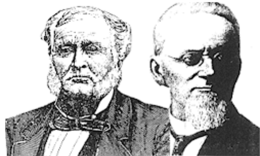
Joseph Glidden und Jacob Haish

1873 meldeten Joseph Glidden und Jacob Haish aus Illinois ein neues, industriell produziertes Viehzaunsystem zum Patent an, welches ihnen im Jahr darauf gewährt wurde; den Stacheldrahtzaun. Mit dieser Erfindung machten sie ein Vermögen und rotteten den Berufsstand des Cowboys aus. Manche sagen, der Westen der USA sei erst wegen dieser arbeitslosen Cowboys zum "Wilden Westen" geworden.